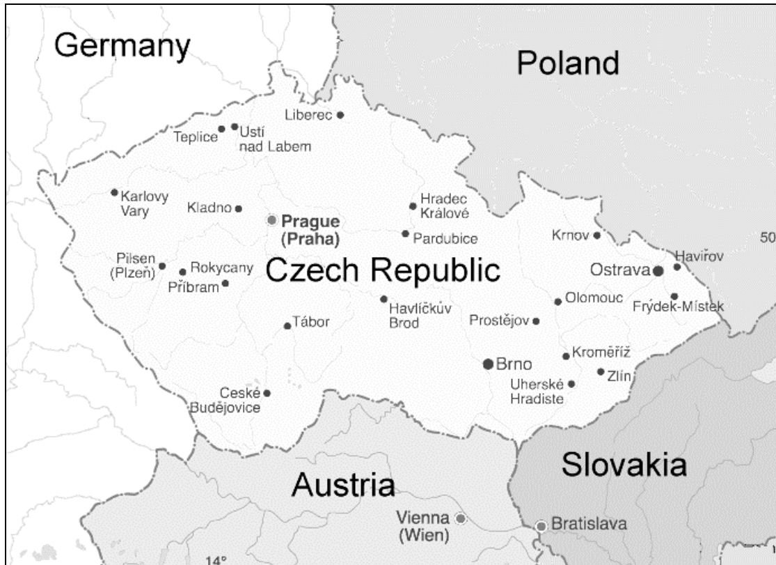
Χάρτης της Τσεχίας