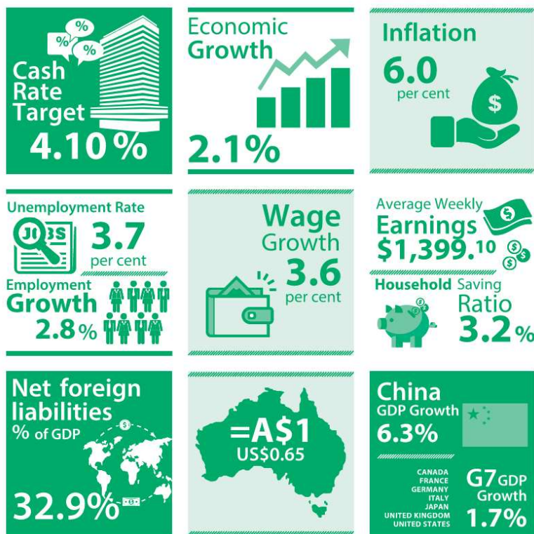
Πίνακας 4: ΑΠΟΤΥΠΩΣΗ ΒΑΣΙΚΩΝ ΔΕΙΚΤΩΝ ΑΥΣΤΡΑΛΙΑΝΗΣ ΟΙΚΟΝΟΜΙΑΣ (07.09.2023)

Πηγή: Reserve Bank of Australia, Επεξεργασία: Γραφείο ΟΕΥ Σύδνεϋ